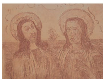
links | George Minne, Adolescent II (Stehender Jüngling), 1923 | Das kunstseidene Mädchen RLT | Königspareade Neusser Schützenfest Mitte links | Edouard Manet, Bildnis von Stéphane Mallarmé, 1876 | California Santa Barbara | James Ensor, Christ et la mer (Christus und das Meer), um 1891 Mitte rechts | James Abbott McNeill Whistler, Herr einen japanischen Holzschnitt bewundernd, um 1900 | Bildmontage Zarathustra!!! TAS rechts | Städtesiegel | Maurice Denis, Femmes aux lilas ou Nus au crépuscule (Frauen mit Flieder oder Akte in der Dämmerung), 1898 | Szenenfoto Off-Theater